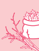
DÉCHETS VÉGÉTAUX (TONTES DE PELOUSE, TAILLES DE HAIES, FEUILLES MORTES,...)