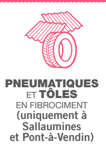
PNEUMATIQUES ET TÔLES EN FIBROCIMENT (uniquement à Sallaumines et Pont-à-Vendin)