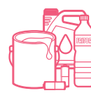
DÉCHETS MÉNAGERS SPÉCIAUX (HUILES, PILES, PHYTOSANITAIRES, PEINTURES, ACIDES,...)