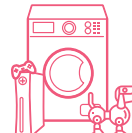
DÉCHETS D'ÉQUIPEMENTS ÉLECTRIQUES ET ÉLECTRONIQUES