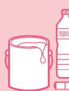
DÉCHETS MÉNAGERS SPÉCIAUX (HUILES ALIMENTAIRES, PILES, PHYTOSANITAIRES, PEINTURES, ACIDES,...)